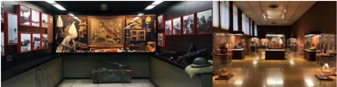
4. 希腊国家考古博物馆