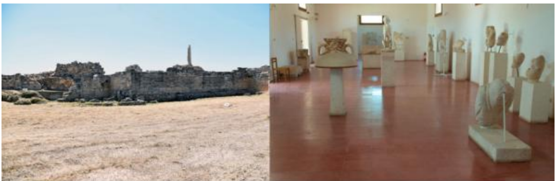
6. 阿法埃娅神庙、阿波罗神庙